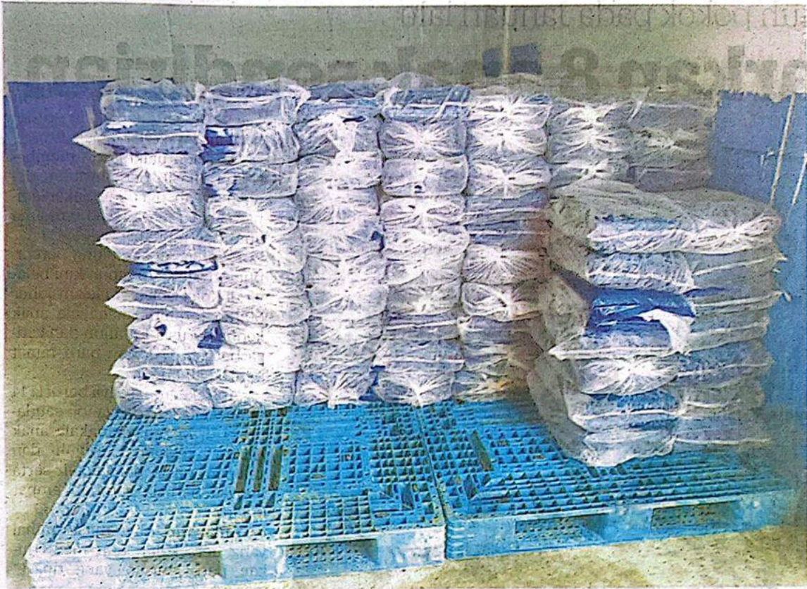
SEBAHAGIAN produk ayam gunting yang dirampas pihak kastam di Machang Isnin lalu selepas didapati diseludup dari Siam melalui Sungai Golok untuk mengelak cukai.