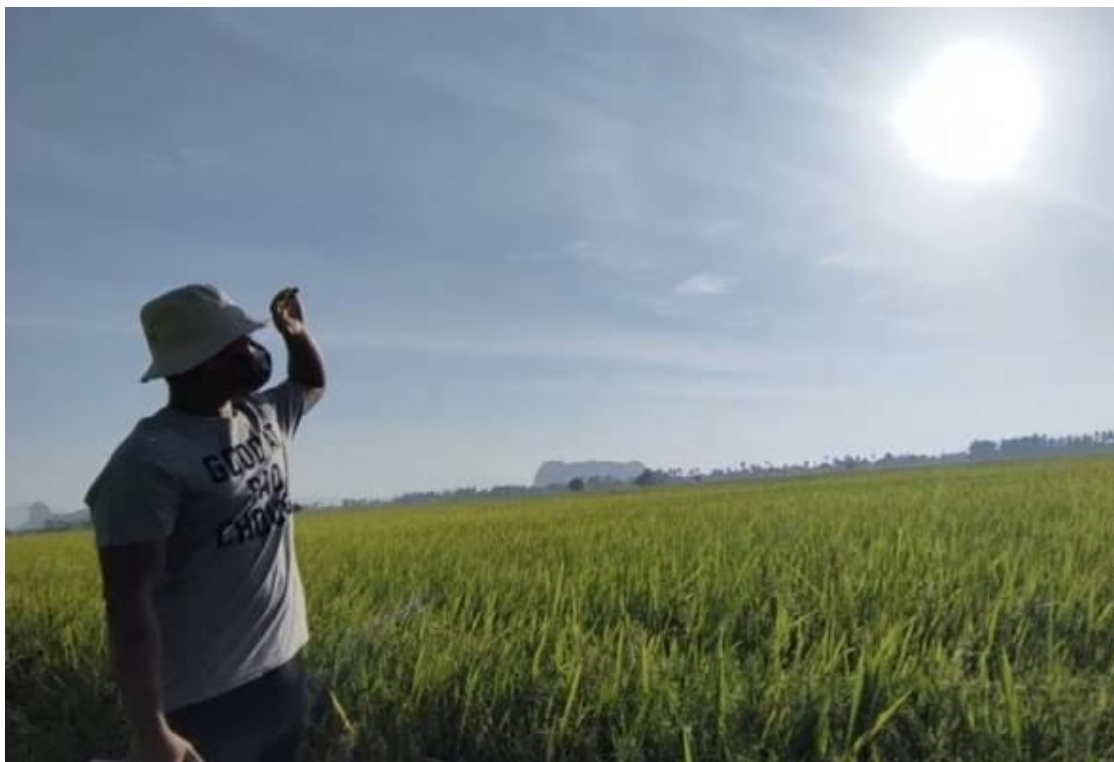
Cuaca panas dengan suhu mencecah 37 hingga 40 darjah Celsius di negeri ini memaksa penternak dan pesawah lebih berhati-hati dalam menjalankan aktiviti penternakan serta pertanian. - Gambar hiasan/Astro AWANI

ALOR SETAR: Cuaca panas dengan suhu mencecah 37 hingga 40 darjah Celsius di negeri ini memaksa penternak dan pesawah lebih berhati-hati dalam menjalankan aktiviti penternakan serta pertanian.